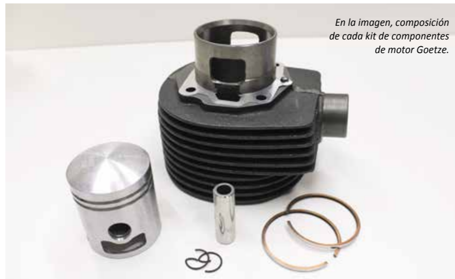
En la imagen, composición de cada kit de componentes de motor Goetze.