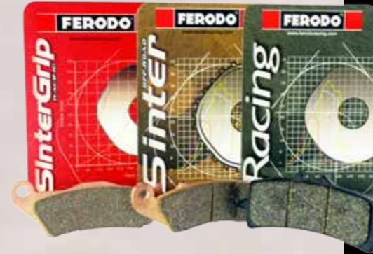
Marca histórica y de referencia en componentes de frenado para moto, la oferta actual de Ferodo consta de discos, pastillas (en la imagen referencias racing), zapatas y líquido de frenos. Su oferta para moto también incluye embragues.