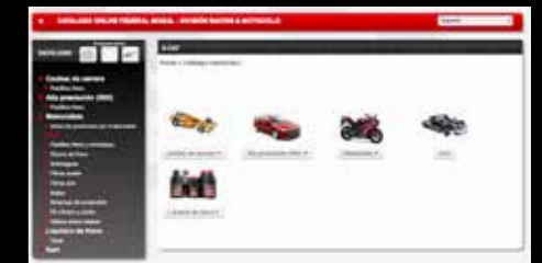
El catálogo on line de Ferodo permite buscar en segundos el producto o el compuesto de frenado indicado para cada modelo de moto.