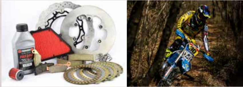
La presencia en el mundo de la competición forma parte del ADN de la división Ferodo Racing & Motorcycle. Bajo la filosofía "from track to road", los avances que desarrolla la marca en las pistas o en los circuitos se aplican después en los componentes "de calle".

La gama de componentes de frenado Ferodo es reconocida por su calidad, fiabilidad, seguridad e innovación. El prestigio de esta mítica actualmente perteneciente a la gigante americana Tenneco es fruto de la constante búsqueda de la excelencia. Veamos qué hay detrás de la marca Ferodo.